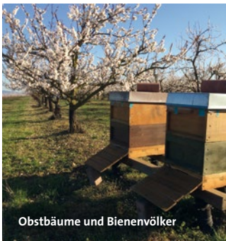
Obstbäume und Bienenvölker