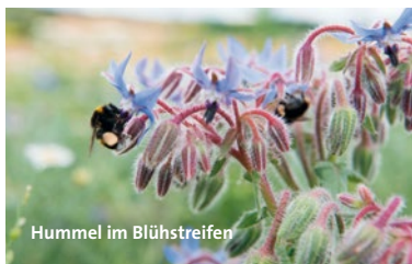
Hummel im Blühstreifen