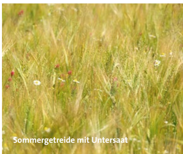
Sommergetreide mit Untersaat