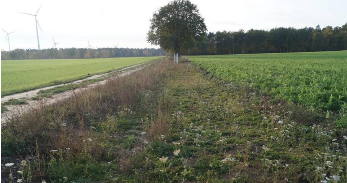
Oberbodenabtrag auf dem Demonstrationsbetrieb bei Lüneburg